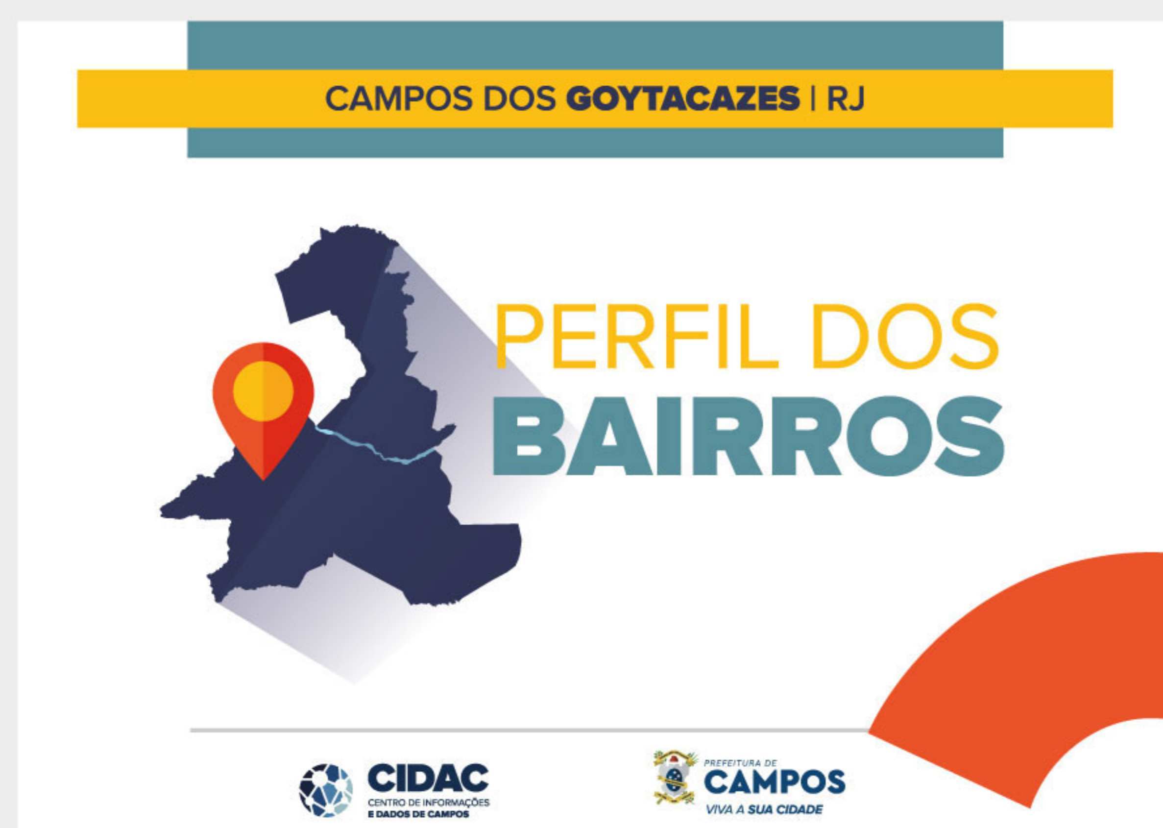
Imagem 1 – Capa Perfil dos Bairros, Campos dos Goytacazes/RJ, 2019.